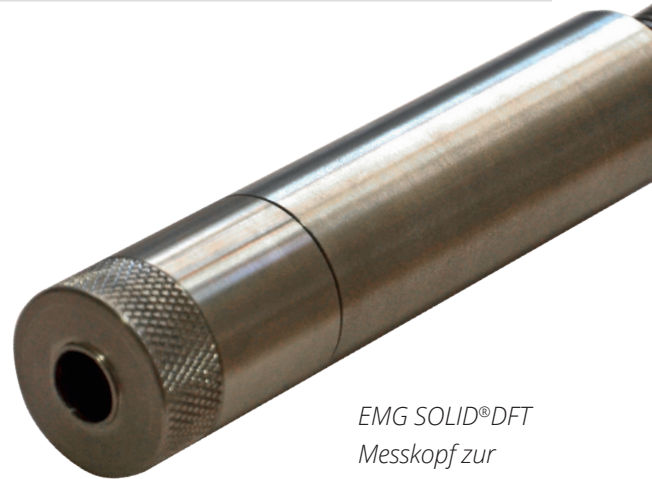
EMG SOLID® DFT Messkopf zur Lackschichtdicken- messung